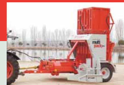
multi pack B14